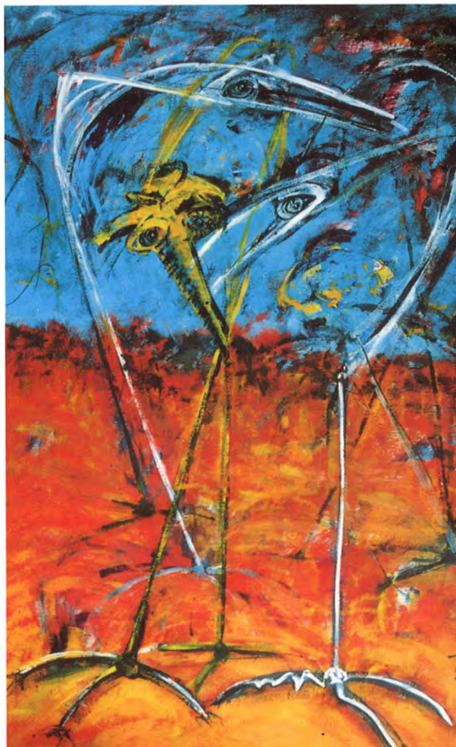
100 x 70 см комб. техника